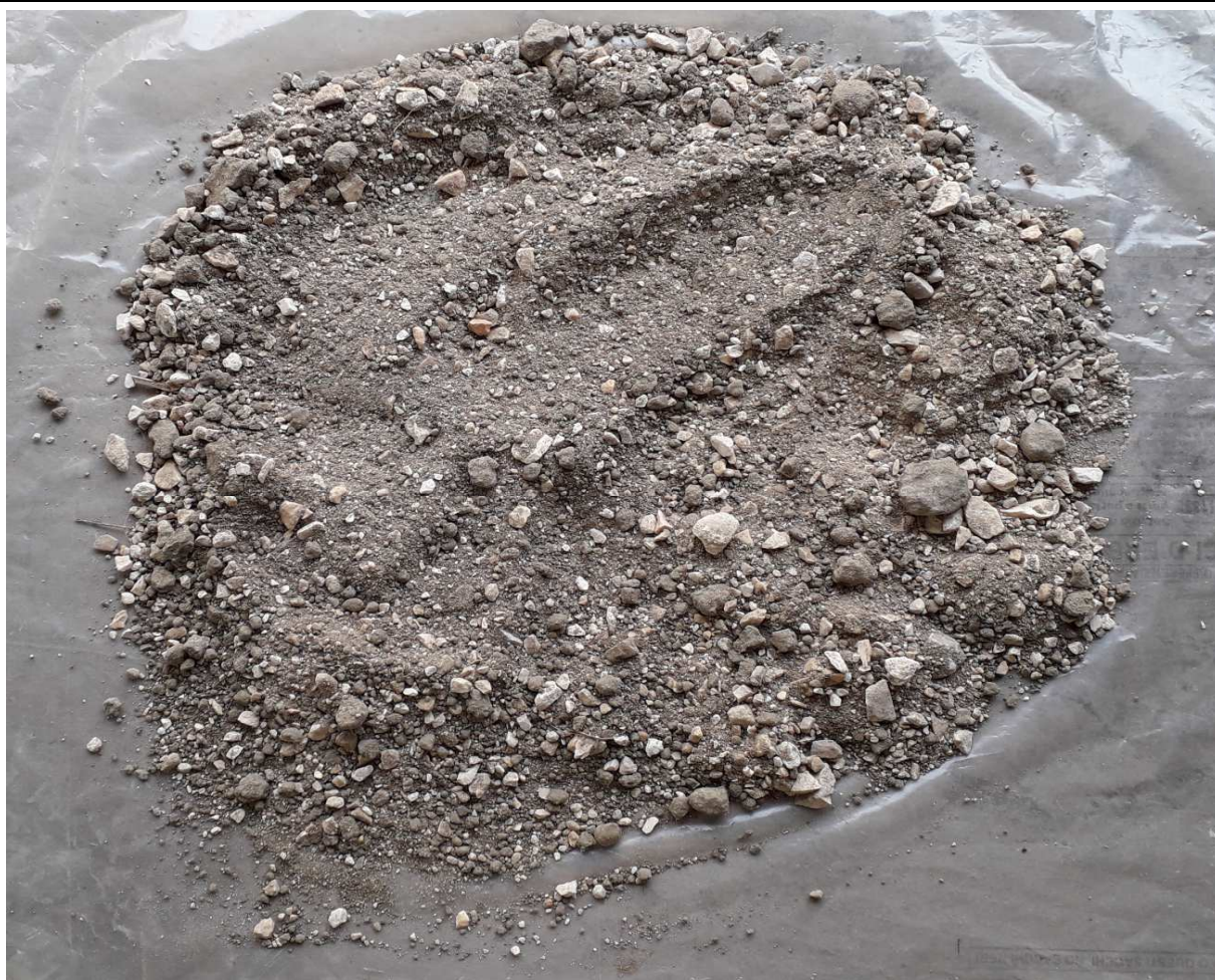
CAMPIONE MEDIO COMPOSITO